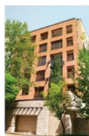
آرام و نجیب